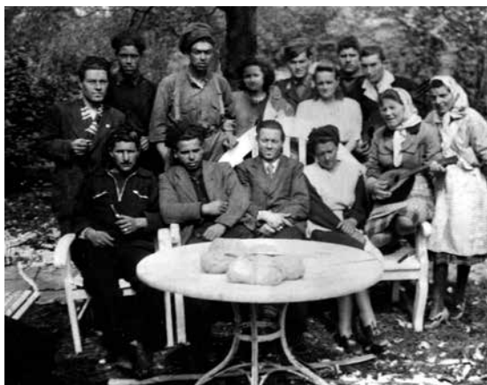
Medina e le compagne con un gruppo di ex internati militari, Germania, Fronte alleato, maggio 1945

citata in Rinchiudere un sogno , a cura di C. Antonini, Edizioni Scritture 2011