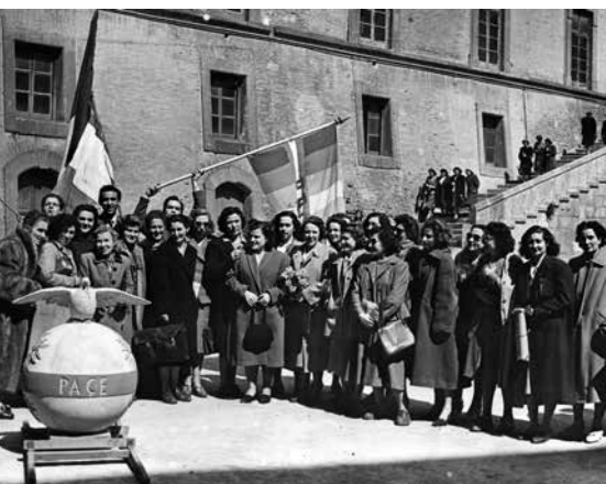
Iniziativa UDI nazionale per la Pace, Napoli 1949

citata in C. Liotti e M. Sandonà, Un paltò per l'Onorevole, Mucchi 2025