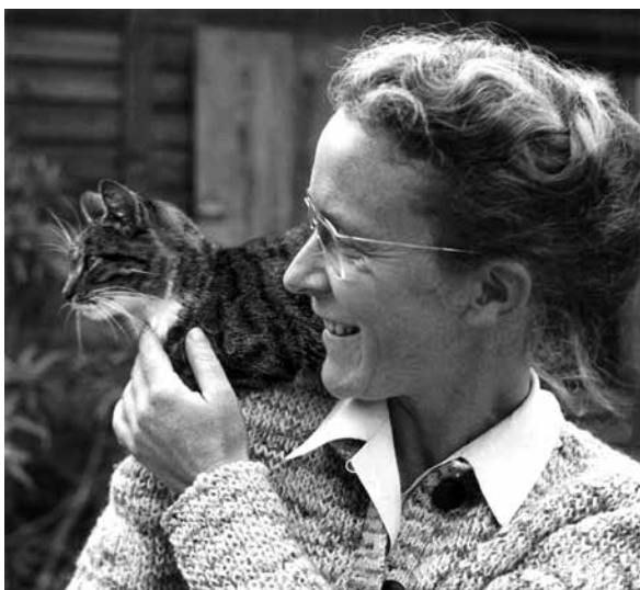
Ritratto, 1949

Nel 1989 riceve la laurea honoris causa in Pedagogia dall'Università di Bologna. Muore a Rimini nel 1996.