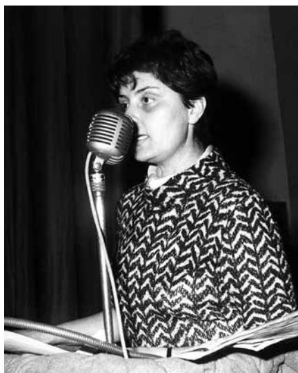
VIII Congresso UDI di Reggio Emilia, 1968

Nei primi anni Cinquanta inizia la sua attività amministrativa, prima come consigliera comunale e assessora a Sant'Ilario d'Enza, poi dal 1956 a Reggio Emilia, in un decennio segnato da lotte per servizi sociali più attenti ai bisogni delle donne, tra cui quella per affidare ai comuni la gestione delle scuole dell'infanzia. Impegno che prosegue anche nella Provincia a partire dal 1970 quando è consigliera e assessora all'Igiene ambientale e ai servizi sociali. Socialista per tutta la vita, è nominata nel Comitato centrale del partito nel 1976 e responsabile della Commissione femminile regionale negli anni Ottanta. Muore a Reggio Emilia nel 2022.