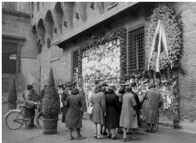
Le donne dell'UDI depositano una corona di fiori al Sacrario dei caduti partigiani, Bologna, 8 marzo 1946