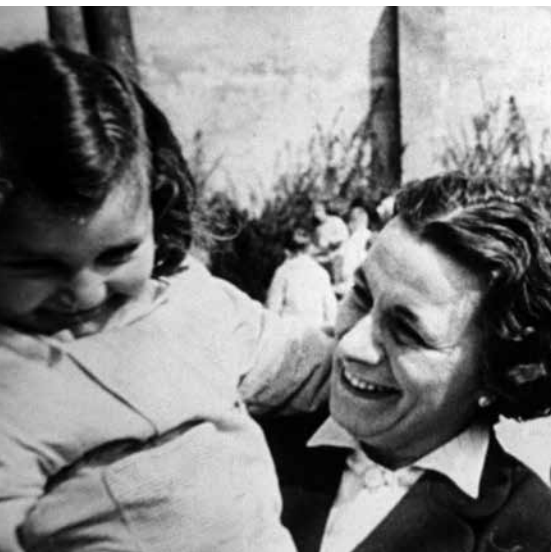
In visita a un asilo, anni Cinquanta

Trascorre l'ultima parte della sua vita a Rapallo dove muore nel 1979. Nel 2016 le sue spoglie vengono riportate a Ferrara e riposano ora nel Cimitero monumentale della Certosa.