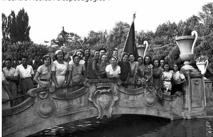
Festa “Avanti!”, Reggio Emilia, 1950