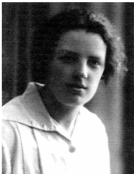
Ritratto Archivio CIF di Forlì

Nel contesto della ricostruzione post-bellica, si dedica a opere sociali, all'assistenza all'infanzia e alla promozione della partecipazione delle donne alla vita della comunità. Sarà anche attiva nella distribuzione degli aiuti internazionali e di quelli della Pontificia commissione di assistenza. Invitata dal vescovo Giuseppe Rolla a entrare nella Democrazia cristiana, sarà candidata e poi eletta nel Consiglio comunale di Forlì, nelle prime elezioni amministrative democratiche del 1946. Dopo quella esperienza tornerà a occuparsi di attività sociali e educative e a dedicarsi al culto eucaristico nella Chiesa di San Filippo Neri. Muore a Forlì nel 1986.