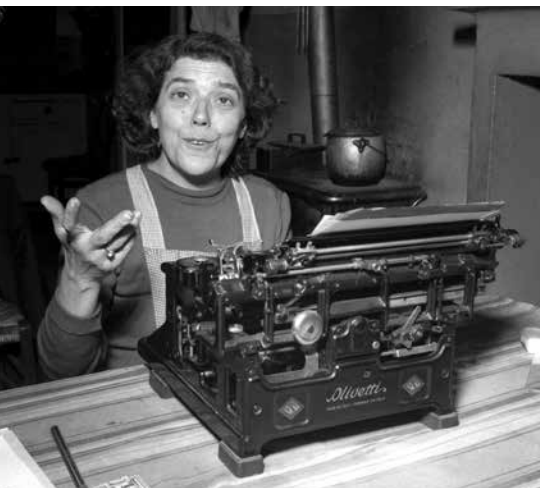
Alla sua macchina da scrivere, Bologna, primi anni Cinquanta

Muore a Bologna nel 1976 senza fare in tempo a vedere la trasposizione cinematografica del suo romanzo.