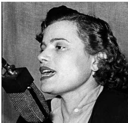
Convegno provinciale UDI di Modena, 18 novembre 1952

Muore nel 2007 a Modena. In città sono a lei dedicate una via, una stele nel parco della Resistenza e la Casa del Mutilato.