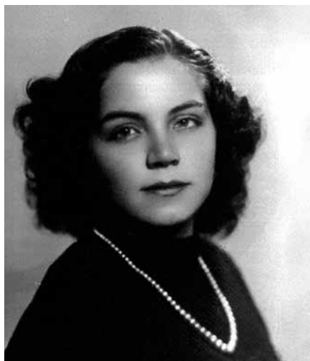
Ritratto ISREC Parma